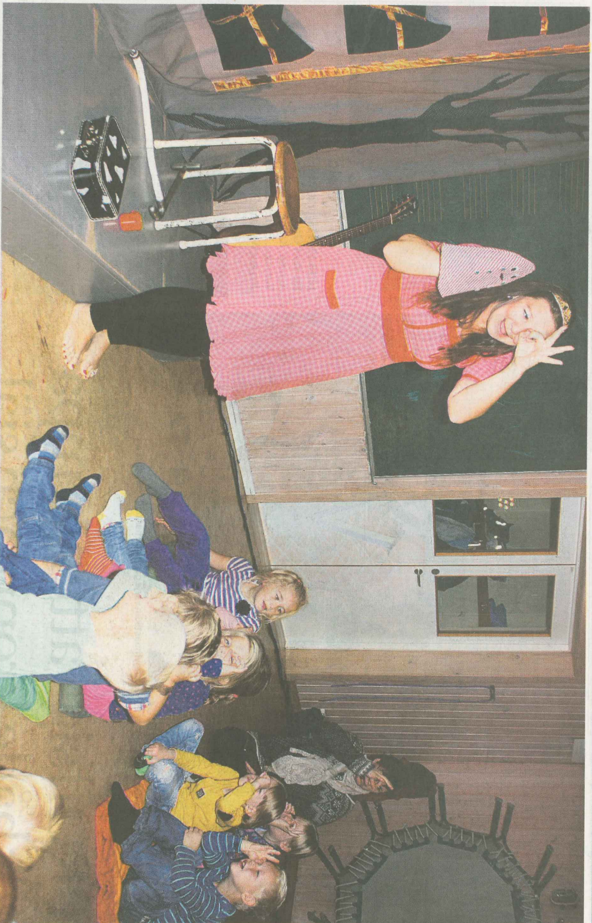
LEDSEN. Det lilla spöket har tappat bort mamma. Men det får skicklig hjälp att leta, av både Sagofén och barn.